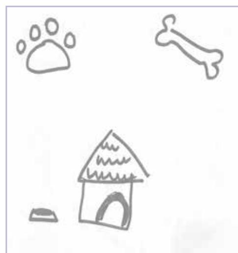
Adultes - Marine