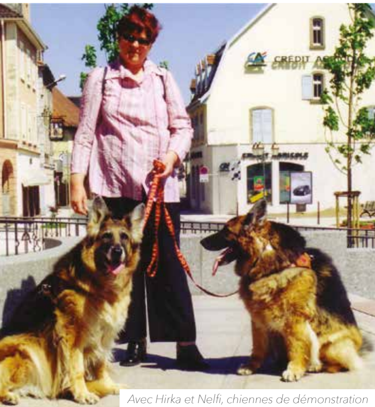
Avec Hirka et Nelfi, chiennes de démonstration