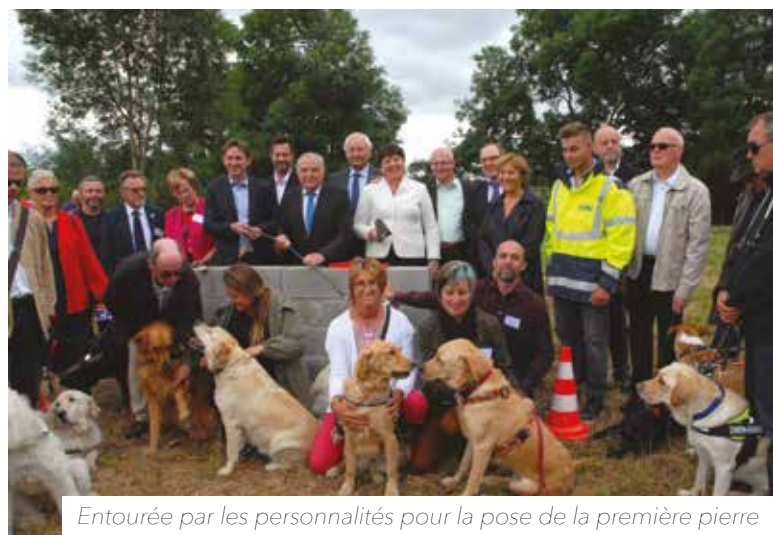
Entourée par les personnalités pour la pose de la première pierre