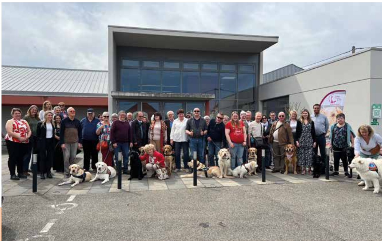
Réunion territoriale Alsace 2025

Nous ne manquerons pas de vous en présenter le bilan dans notre prochain numéro.