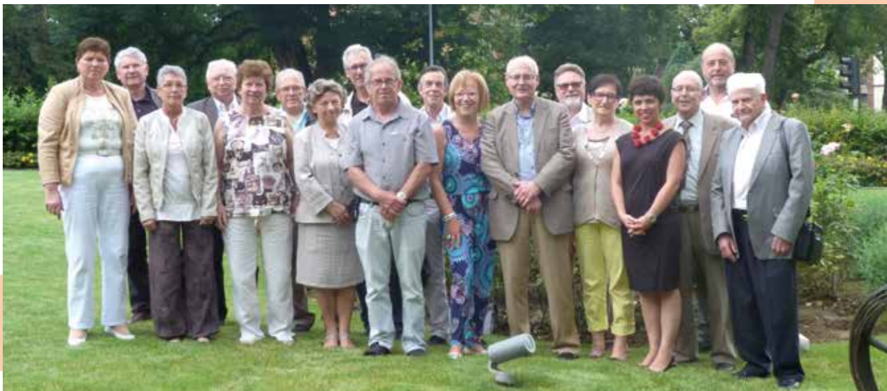
La première assemblée générale des Chiens Guides de l'Est.